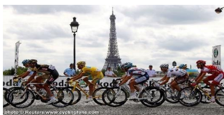
Le Tour de France